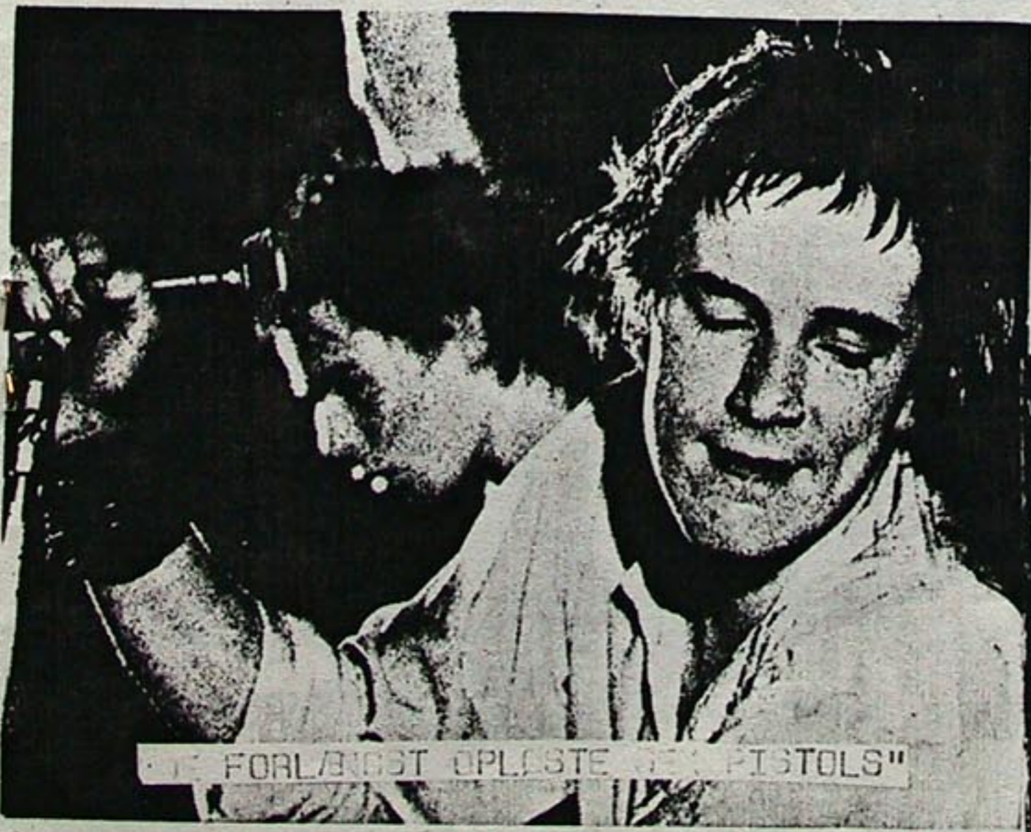
FORLÆNGST OPLØSTE SEX PISTOLS"

De forlængst opløste SEX PISTOLS har fået sendt en ny LP ud, den hedder "The heyday" og indeholder sikkert de gamle numre. T.N.